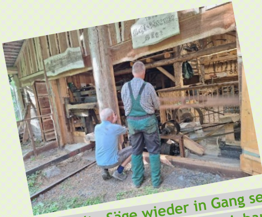
Die alte Säge wieder in Gang setzen und neue Treibriemen einbauen