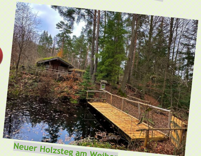
Neuer Holzsteg am Weiher